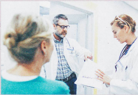
Fehler vermeiden: Vorgesetzte sollten die Mitarbeitenden um ihre Meinung fragen.