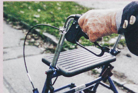
Manche Senioren lehnen den Rollator ab, weil sie dem Bild der fiten Alten entsprechen wollen.

F. Rickli: Old, disabled, successful? Transfigurations of aging with disabilities in Switzerland. In: Medical Anthropology Theory (in preparation).