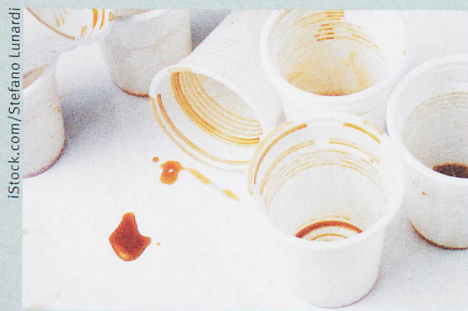
Regelmässiger Kaffeekonsum macht schläfrig – beim Entzug.