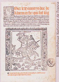
Französische Texte waren im 15. Jahrhundert gefragt. Dies führte zur Erfindung des Ritterromans.

A. Franc: Early origins of Fair Trade: From the United Nations Conference on Trade and Development 1964 to the Tanzanian instant coffee campaign 1973–75 (in preparation)