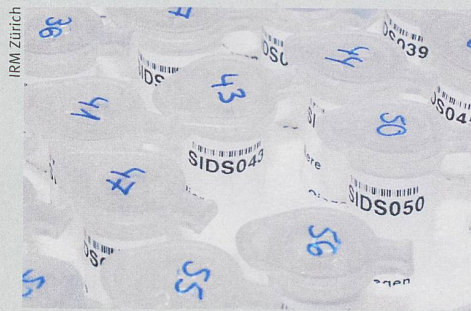
Was von den Verstorbenen übrigblieb: Die extra-hierte DNA für Suche nach der Todesursache.