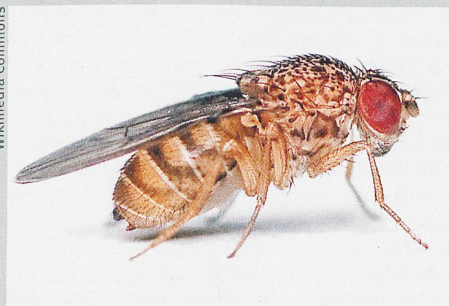
Andere Lebensräume, andere Körpermasse. Hier eine andere Taufliège: Drosophila repleta

P. T. Rohner et al.: Interrelations of global macroecological patterns in wing and thorax size, sexual size dimorphism, and range size of the Drosophilidae . Ecography (2018)