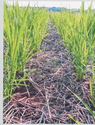
Reisanbau in Madagaskar: Nützt der traditionelle Hofdünger aus Pflanzenabfällen?