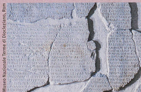
Museo Nazionale Terme di Diocleziano, Rom

B. Schnegg, Commentaria ludorum saecularium , De Gruyter (erscheint 2019)