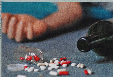
Ein erschwerter Zugang zu Medikamenten könnte Suizide verhindern.

P. Pfeifer et al.: Acute and chronic alcohol use correlated with methods of suicide in a Swiss national sample. Drug and Alcohol Dependence (2017)