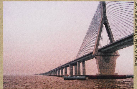
Die Möglichkeit, Risse in Hochleistungsbeton vorherzusagen, macht Bauwerke sicherer.