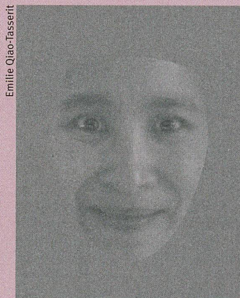
Freude oder Angst?