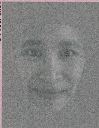
Freude oder Angst?