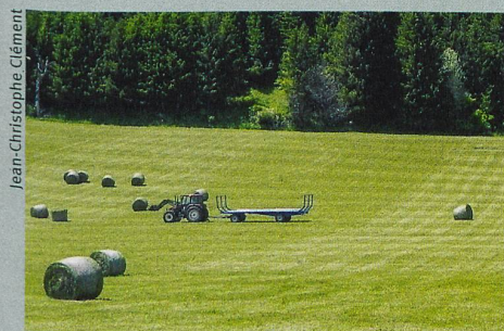
Wenn die Mikroorganismen im Boden leiden, erhalten die Pflanzen mehr Nährstoffe.

N. Legay et al.: Soil legacy effects of climatic stress, management and plant functional composition on microbial communities influence the response of Lolium perenne to a new drought event. Plant and Soil (2017)