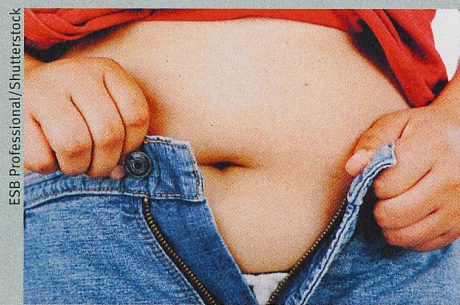
Ein dicker Bauch vermindert die Beweglichkeit und die Popularität von Kindern.