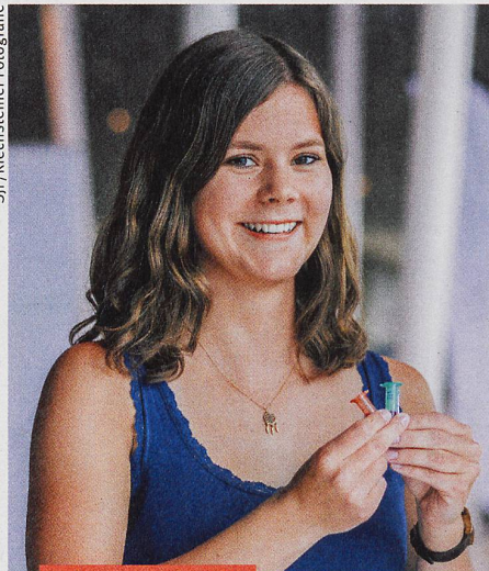
Wissen und Politik