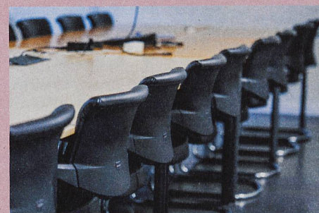
Klar definierte Regeln verbessern den Umgangston an Sitzungen.

I. Odermatt, C. König, M. Kleinmann: Incivility in Meetings: Predictors and Outcomes. Journal of Business and Psychology (2017)