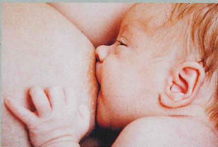
Verhindern kann die Muttermilch die Erkältungen nicht, aber deren Verlauf abmildern.