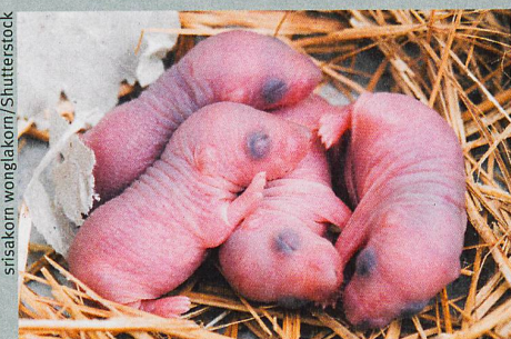
Das Immunsystem von Mäusejungen wird schon im Bauch ihrer Mutter trainiert.

S. C. Ganai-Vonarburg et al.: Maternal microbiota and antibodies as advocates of neonatal health. Gut Microbes (2017)