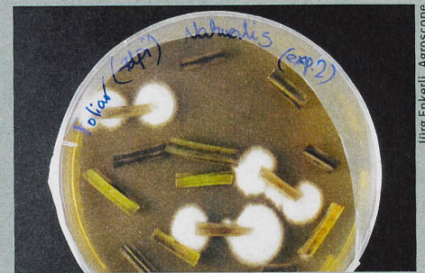
Ein Pilz befällt die Stängel von Ackerbohnen und kann gleichzeitig deren Wachstum fördern.

L. R. Jaber, J. Enkerli: Fungal entomopathogens as endophytes: can they promote plant growth? Biocontrol Science and Technology (2017)