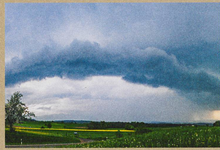
Wetterfronten werden feuchter und stärker.