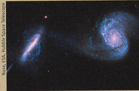
Supermassenreiche schwarze Löcher entstehen, wenn Galaxien verschmelzen.