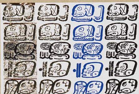
Die Maya-Handschriften des Dresdner Kodex (linke Reihe) digital restauriert.

Mayan hieroglyphs from the Dresden Codex, manually processed by Carlos Pallán Gayol, based on the 1880 facsimile by Ernst Förstemann