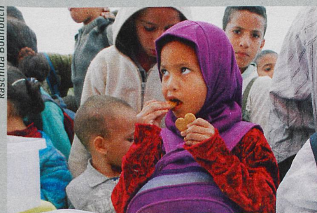
Geniessen für die Gesundheit: Kinder profitierten doppelt von eisenhaltigen Biskuits.

R. R. Bouhouch et al.: Effects of wheat-flour biscuits fortified with iron and EDTA, alone and in combination, on blood lead concentration, iron status, and cognition in children: a double-blind randomized controlled trial. The American Journal of Clinical Nutrition (2016)