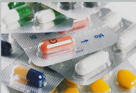
Blutungen und Muskelschwund: je mehr Wirkstoffe und Ärzte, desto mehr Nebenwirkungen.