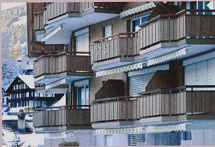
Die Initiative gegen kalte Betten wirkt unerwartet: Erstwohnungen haben an Wert verloren.