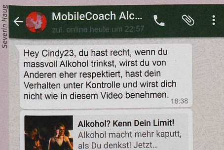
Das Programm erreicht Teenager per SMS dort, wo sie Alkohol trinken: abends an der Party.

S. Haug et al.: Efficacy of a Web- and Text Messaging-Based Intervention to Reduce Problem Drinking in Adolescents: Results of a Cluster-Randomized Controlled Trial. Journal of Consulting and Clinical Psychology (2016)