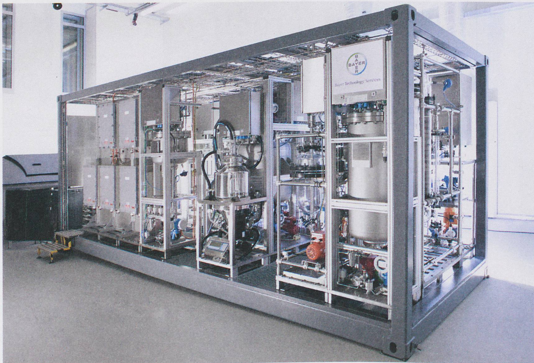
Eine standardisierte Minifabrik, transportierbar im Container: Dies ist die Vision des europäischen Forschungsprojekts F3-Factory.