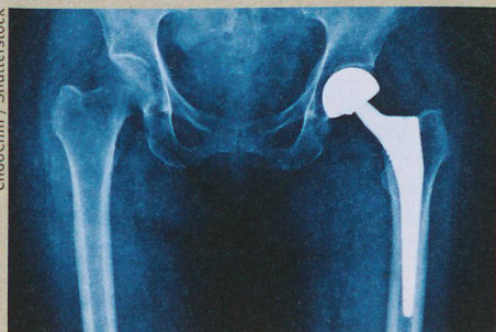
Mit silberhaltigen Nanokügelchen könnten Bakterien in Hüftgelenken ferngehalten werden.

M. Priebe et al.: Antimicrobial silver-filled silica nanorattles with low immunotoxicity in dendritic cells. Nanomedicine (2016)