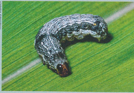
Gegen den Baumwollwurm und andere Feinde muss die Pflanze ihre Abwehrkräfte einteilen.