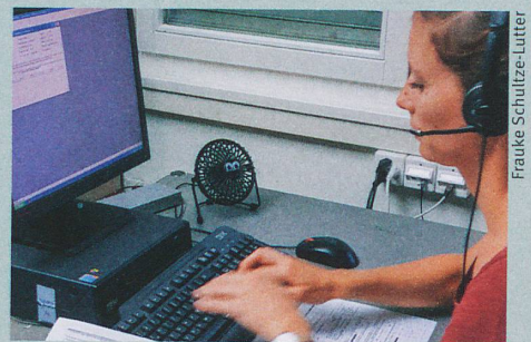
Mit gezielten Fragen werden unentdeckte psychische Leiden entdeckt.

C. Michel et al.: Demographic and clinical characteristics of diagnosed and non-diagnosed psychotic disorders in the community. Early Intervention in Psychiatry (2016)