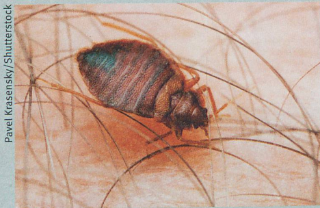
Ungemütliche Bettgenossen: Die Blutsauger werden immer resistenter gegen Insektizide.