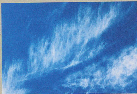
Zirren wirken wie mit feinen Pinselstrichen gemalt. Ihr Einfluss aufs Klima ist aber beachtlich.