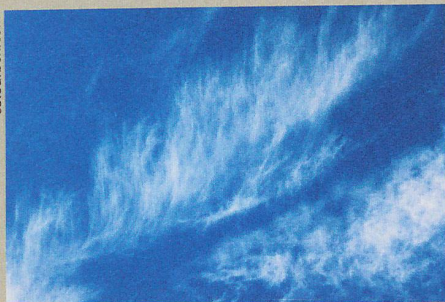
Zirren wirken wie mit feinen Pinselstrichen gemalt. Ihr Einfluss aufs Klima ist aber beachtlich.