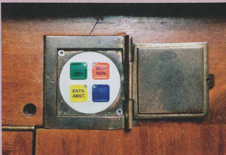
Durch die elektronische Abstimmung wird genau nachvollziehbar, wer sich wie entschieden hat.