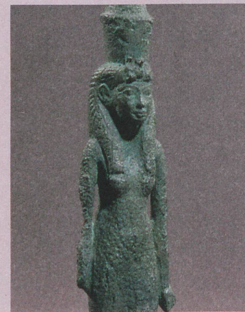
Hier ist sie ein Mensch. Doch Mut erscheint manchmal auch als Geier.