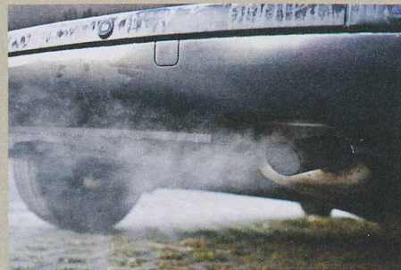
Das Ziel: weniger Russ in den Abgasen.