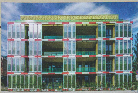
Die Algen im Hamburger BIQ-Haus produzieren Biomasse und inspirieren Forschende.