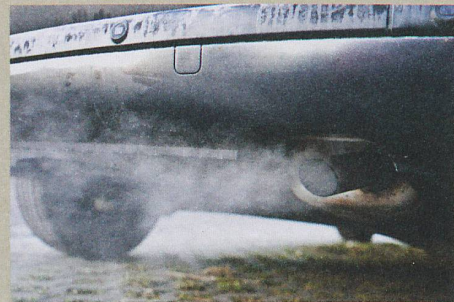
Das Ziel: weniger Russ in den Abgasen.