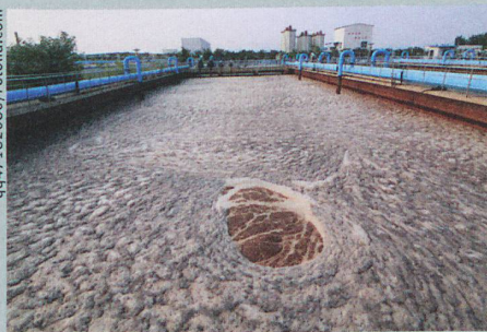
In verdünntem Klärschlamm wachsen Antibiotika-resistente Bakterien besonders gut.

B. Ricken et al.: Degradation of sulfonamide antibiotics by Microbacterium sp. strain BR1 – elucidating the downstream pathway. New Biotechnology (2015)