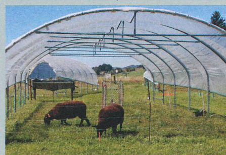
Mit dem Gewächshaustunnel simulierten die Forscher einen sehr trockenen Sommer.

C. Deléglise et al.: Drought-induced shifts in plants traits, yields and nutritive value under realistic grazing and mowing managements in a mountain grassland. Agriculture, Ecosystems & Environment (2015)