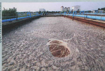
In verdünntem Klärschlamm wachsen Antibiotika-resistente Bakterien besonders gut.

B. Ricken et al.: Degradation of sulfonamide antibiotics by Microbacterium sp. strain BR1 – elucidating the downstream pathway. New Biotechnology (2015)