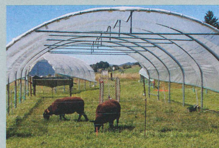
Mit dem Gewächshaustunnel simulierten die Forscher einen sehr trockenen Sommer.

C. Deléglise et al.: Drought-induced shifts in plants traits, yields and nutritive value under realistic grazing and mowing managements in a mountain grassland. Agriculture, Ecosystems & Environment (2015)