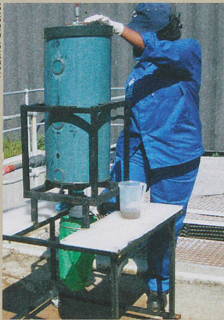
Dieser Reaktor wandelt Urin in den festen und sicheren Dünger Struvit um.