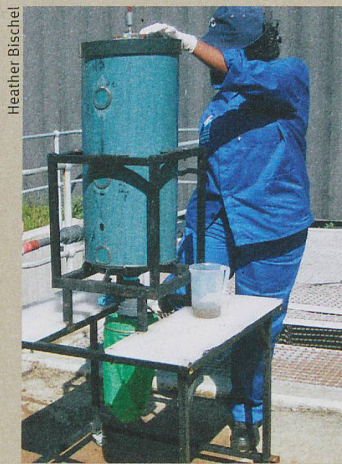
Dieser Reaktor wandelt Urin in den festen und sicheren Dünger Struvit um.