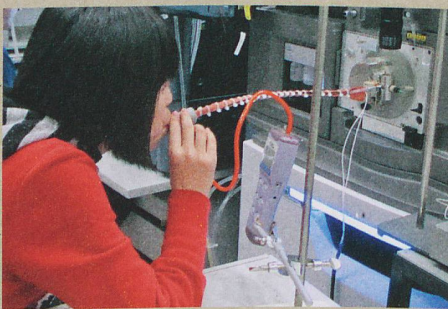
Der Atemtest mit dem Massenspektrometer erlaubt, Lungenerkrankungen zu erkennen.

P. Martinez-Lozano Sinues et al.: Breath Analysis in Real Time by Mass Spectrometry in Chronic Obstructive Pulmonary Disease. Respiration , 2014