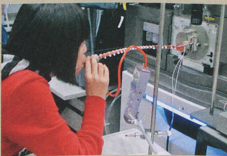
Der Atemtest mit dem Massenspektrometer erlaubt, Lungenerkrankungen zu erkennen.

P. Martinez-Lozano Sinues et al.: Breath Analysis in Real Time by Mass Spectrometry in Chronic Obstructive Pulmonary Disease. Respiration , 2014