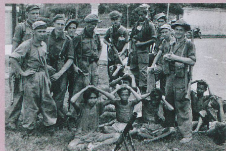
Niederländische Soldaten posieren auf Java mit einer Gruppe indonesischer Kriegsgefangener.

R. Limpach: Business as usual: Dutch mass violence in the Indonesian war of independence 1945–49, in: B. Luttikhuis et al. (Eds.): Colonial Counterinsurgency as Mass Violence. The Dutch Empire in Indonesia. Routledge, New York, 2014