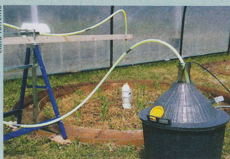
Die Schadstoffe sickern durch das Stück Boden, werden aufgefangen und analysiert.

C. Torrentó et al.: Fate of four herbicides in an irrigated field cropped with corn: lysimeter experiments. Procedia Earth and Planetary Science , 2015