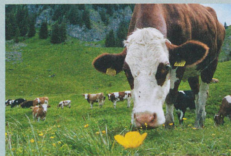
Der Methanausstoss von Kühen könnte durch gezielte Zucht vermindert werden.