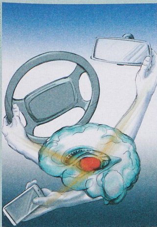
Ob der Blick auf die Strasse oder das Smartphone fällt, entscheidet sich tief im Gehirn.