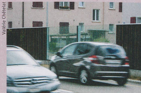
Das soziale Umfeld und Vorbilder bestimmen mit, ob jemand leise fährt.