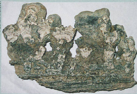
Diese Kalksteine bestehen aus Ausscheidungen von Bakterien.