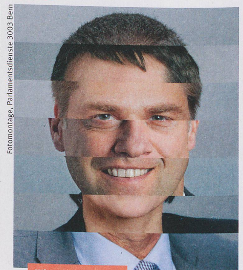
Fotomontage, Parlamentsdienste 2003 Bern