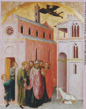
Der Heilige Stephanus von Martino Di Bartolomeo (um 1435) wird von einer Hirschkuh gestillt.

Y. Foehr-Janssens et al.: Représentations de l'allaitement au moyen âge: invisibilité ou prolifération matérielle et légendaire. Allaitement et pratiques de sevrage . (eingereicht, 2015)