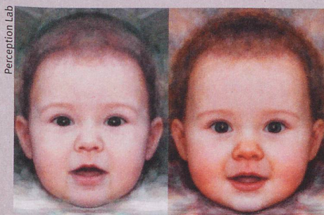
Kleiner, aber bedeutender Unterschied: Das Baby rechts erzeugt den grösseren Jö-Effekt.

J.S. Lobmaier et al.: Menstrual cycle phase affects discrimination of infant cuteness. Hormones & Behavior . 2015