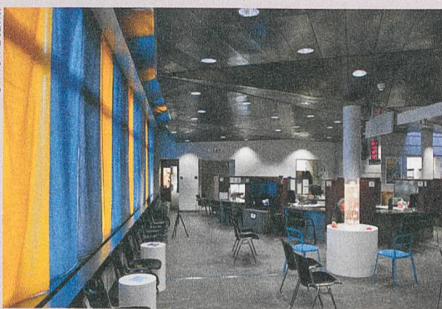
Diskret, nicht aufdringlich: Umgestaltete Besucherräume der Einwohnerdienste der Stadt Bern.