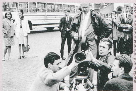
Aufbruch: Schweizer Filmschüler lernen um 1968 das Handwerk (in Antwerpen).