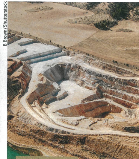
Umwelt und Technik