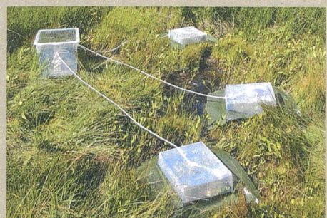
Schwefelfalle: Versuchsaufbau an der Gola di Lago im Tessin.