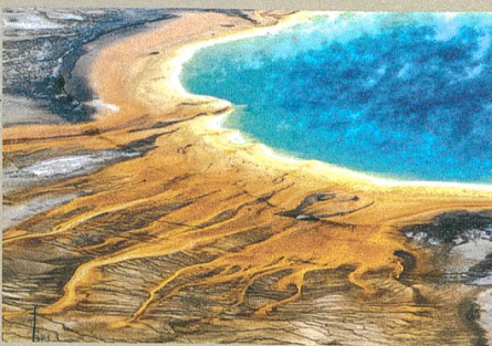
Wo einst ein Supervulkan ausbrach, hat sich ein kleiner See gebildet (Yellowstone Nationalpark).

W.J. Malfait et al. (2014): Supervolcano eruptions driven by melt buoyancy in large silicic magma chambers. Nature Geoscience 7, 122–125.