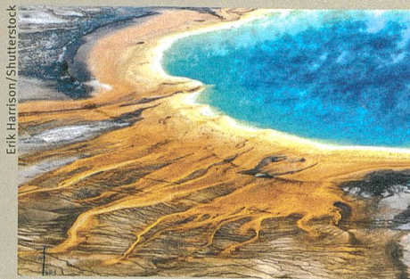
Wo einst ein Supervulkan ausbrach, hat sich ein kleiner See gebildet (Yellowstone Nationalpark).

W.J. Malfait et al. (2014): Supervolcano eruptions driven by melt buoyancy in large silicic magma chambers. Nature Geoscience 7, 122–125.