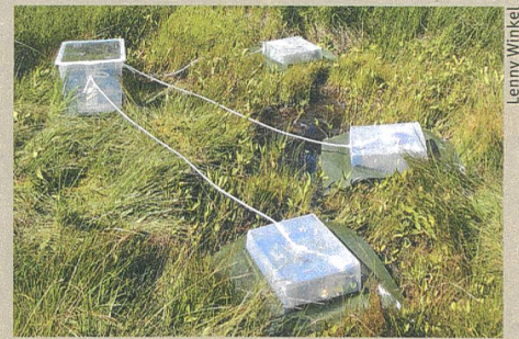
Schwefelfalle: Versuchsaufbau an der Gola di Lago im Tessin.