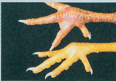
Die Hühnerkrallen oben sind von der Vogelgrippe gezeichnet, die unten sind gesund.