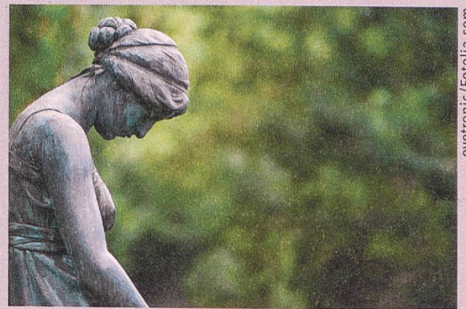
Vulnerabilitätseffekt: Grosse Selbstzweifel stimmen auf die Dauer unfroh.

U. Orth, R.W. Robins (2013): Understanding the link between low self-esteem and depression. Current Directions in Psychological Science 22: 455-460.