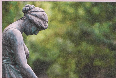
Vulnerabilitätseffekt: Grosse Selbstzweifel stimmen auf die Dauer unfroh.

U. Orth, R.W. Robins (2013): Understanding the link between low self-esteem and depression. Current Directions in Psychological Science 22: 455–460.