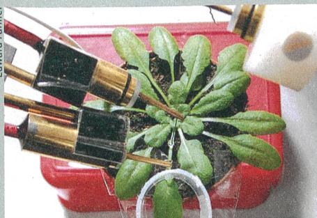
Unter Strom: Die Elektroden messen die elektrischen Aktivitäten der Acker-Schmalwand.