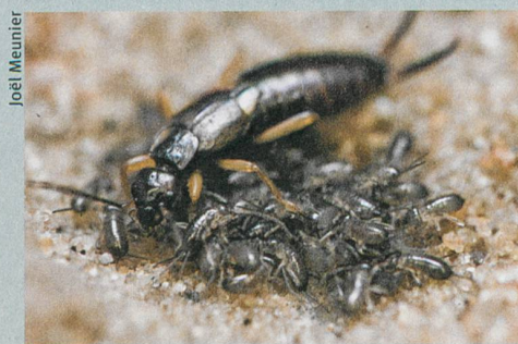
Ein Ohrwurmweibchen pflegt seine Jungen.

J.W.Y. Wong, C. Lucas & M. Kölliker (2014): Cues of Maternal Condition Influence Offspring Selfishness. PLoS ONE 9: e87214.