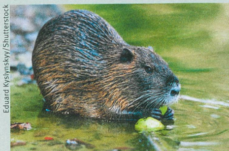
Auch die Bisamratte ist unerwünscht.

Tim M. Blackburn et al. (2014): A Unified Classification of Alien Species Based on the Magnitude of their Environmental Impacts. PLoS Biology 12: e1001850.