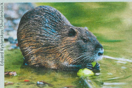
Auch die Bisamratte ist unerwünscht.

Tim M. Blackburn et al. (2014): A Unified Classification of Alien Species Based on the Magnitude of their Environmental Impacts. PLoS Biology 12: e1001850.