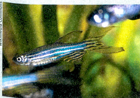
Klein und smart: Der Zebrafisch kann sein Herz nach einem Infarkt regenerieren.

Das Ergebnis ist beeindruckend: Nach einem Infarkt konnten die Nagetiere ihre Herzfunktion wiederherstellen. Zu Beginn des Lebens besitzen alle Herzzellen die Fähigkeit, sich zu erneuern. Beim Zebrafisch bleibt diese Fähigkeit lebenslang erhalten, die Säugetiere verlieren sie hingegen nach der Geburt. «Vermutlich sorgen die Mikro-RNA dafür, dass die Herzzellen ins Embryonalstadium zurückkehren und sich regenerieren können. Wenn es uns gelingt, diese Mikro-RNA beim Menschen zu steuern, können wir vielleicht Infarktpatienten heilen», sagt Thierry Pedrazzini. Caroline Ronzaud