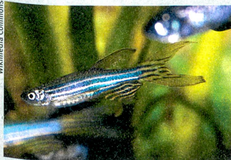
Klein und smart: Der Zebrafisch kann sein Herz nach einem Infarkt regenerieren.