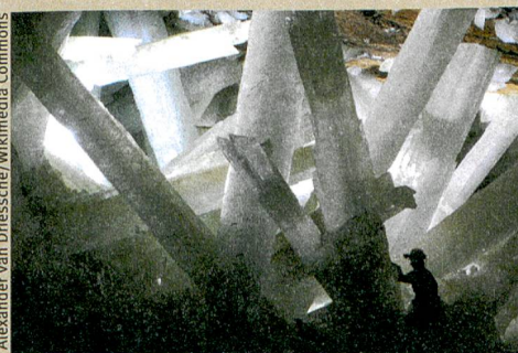
Forscher im Wunderland: Gipskristalle in der mexikanischen Mine Naica.

Y. Krüger, J. M. García-Ruiz, À. Canals, D. Marti, M. Frenz, A.E.S. Van Driessche. Determining gypsum growth temperatures using monophasic fluid inclusions – Application to the giant gypsum crystals of Naica, Mexico. Geology (2013): 41, 2, 119–122.