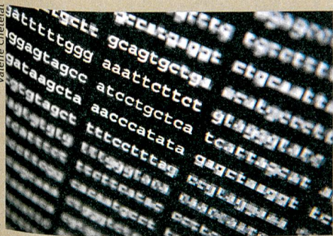
Daten auf DNA speichern: Zu fast hundert Prozent zuverlässig.