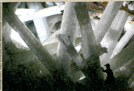
Forscher im Wunderland: Gipskristalle in der mexikanischen Mine Naica.

Y. Krüger, J. M. García-Ruiz, À. Canals, D. Martí, M. Frenz, A.E.S. Van Driessche. Determining gypsum growth temperatures using monophasic fluid inclusions – Application to the giant gypsum crystals of Naica, Mexico. Geology (2013): 41, 2, 119–122.