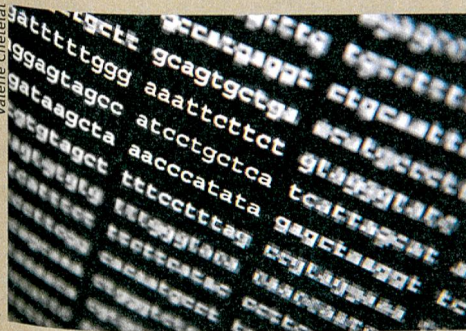
Daten auf DNA speichern: Zu fast hundert Prozent zuverlässig.